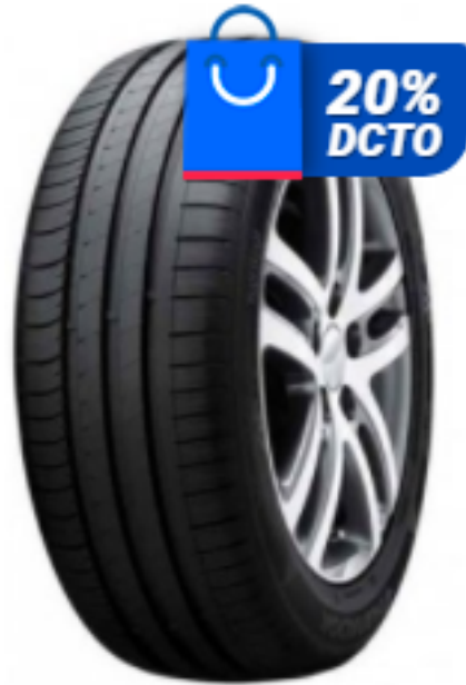
Imagen que identifica los productos que son parte de la oferta Cyber Monday 2018.